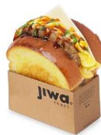
Gambar 2.2 Salah satu menu Jiwa Toast, yaitu Spicy Bulgogi

Jiwa Toast pertama kali muncul pada bulan Mei 2019 sebagai bentuk gaya baru dalam menikmati toast bread (roti bakar) dan hadir memiliki konsep sederhana dan citra rasa yang unik untuk melengkapi Kopi Janji Jiwa. Sama seperti dengan Kopi Janji Jiwa, Jiwa Toast dibuat dengan berbagai bahan dasar dengan kualitas terbaik dan dibuat secara fresh .