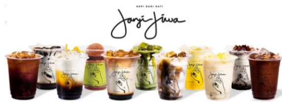
Gambar 2.1 Kopi Janji Jiwa

terdalam untuk menyajikan kopi sebagai salah satu passion -nya (Iman, 2019). Kedai Kopi Janji Jiwa menawarkan ragam kopi lokal Indonesia dengan harga terjangkau yang menggunakan konsep fresh-to-cup .