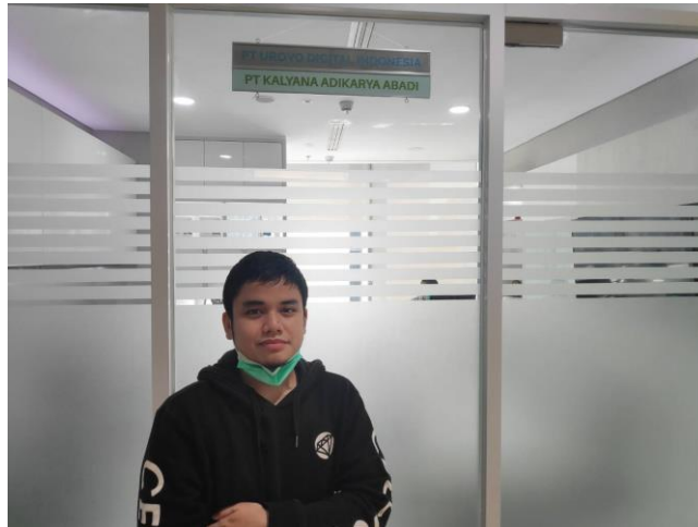
Gambar 2. 3 Tampak Depan Ruangan Kantor