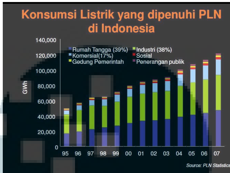
Tabel 3.1 Konsumsi Listrik (PLN Statistics dari situs http://earthhour.wwf.or.id/ )

Menurut data dari BPS (Badan Pusat Statistik Indonesia) pengguna listrik di Indonesia terhitung dengan jumlah pelanggan di setiap sektor pengguna listrik di Indonesia yang dapat dilihat pada tabel berikut :