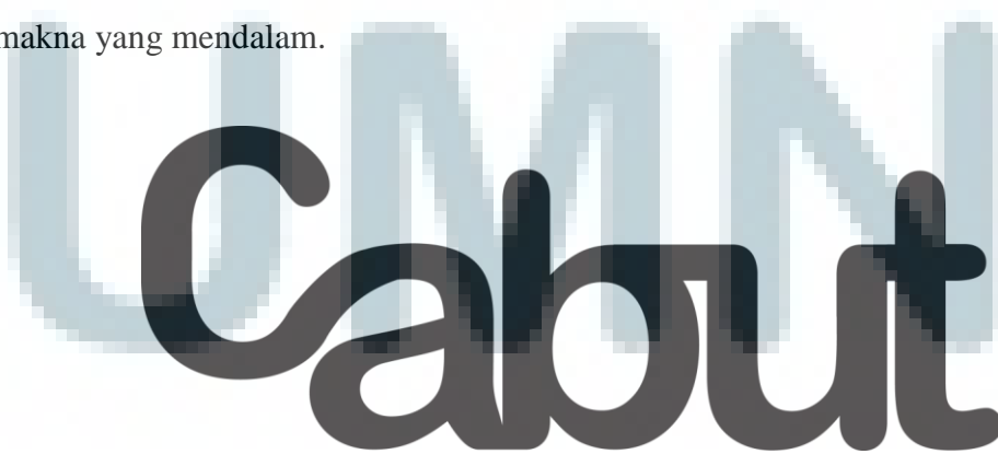
Gambar 3.5 Logotype Kampanye sosial “Cabut”

Pada visualisasi dari logotype , adalah sebuah kabel panjang dari “colokan” yang tergambar pada logoram dan membentuk sebuah kata sebagai maksud dan tujuan dari kampanye, yaitu “Cabut”. penulisan kata “Cabut” dibuat sangat simpel dan mudah untuk dibaca dan dipahami. Dikarenakan, tidak perlu pemahaman khusus untuk membaca dan mengerti apa yang dimaksudkan. bentuknya yang tidak tajam, membuatnya terlihat bersahabat bagi siapapun, namun memiliki makna yang mendalam.