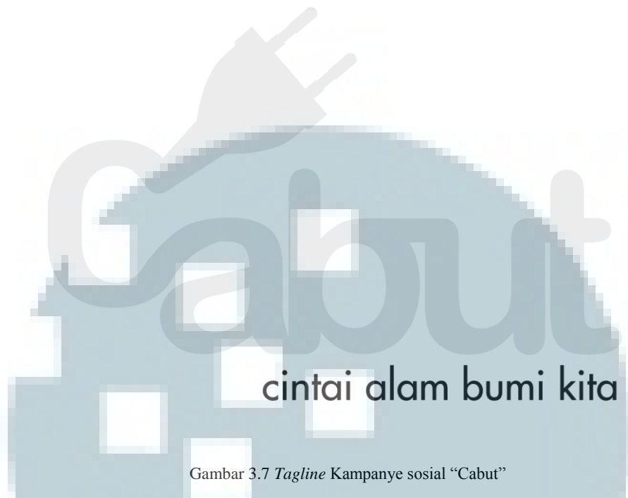
Gambar 3.7 Tagline Kampanye sosial “Cabut”

Tagline yang dibuat adalah kepanjangan dari logo branding “Cabut” sebagai penegas. Font yang digunakan adalah typeface Futura.std. pemilihan ini dimaksud agar terbaca jelas dan bentuknya yang tidak kaku dimaksudkan agar ajakan yang dituju dilakukan secara tegas namun halus, agar memberikan keinginan untuk melakukan dan berpartisipasi tanpa unsur keterpaksaan.