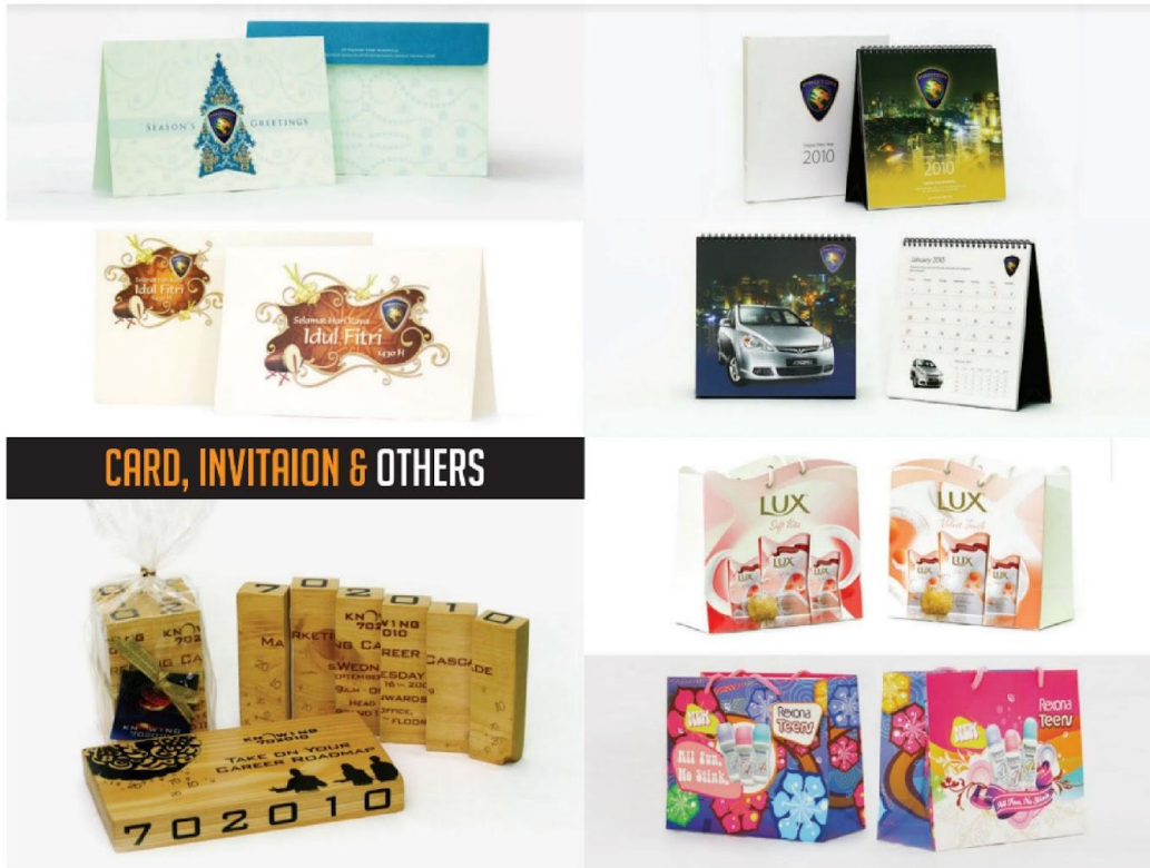
Gambar 2.2. Portofolio Studio Dampu Design