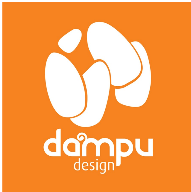
Gambar 2.1. Logo studio Dampu Design

Studio kami menyediakan jasa pembuatan kartu undangan untuk segala kebutuhan seperti kartu undangan pernikahan, kartu undangan event, dan lain-lain.