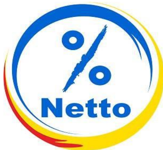
Gambar 2.1 Logo Perusahaan Netto Networks

Pada gambar 2.1 adalah logo perusahaan Netto Networks yang merupakan sebuah perusahaan start-up yang didirikan pada tanggal 3 mei 2020. Netto Networks berada di Kota Depok tepatnya di jalan Tanah Baru No.6 Pancoran. Perusahaan Netto Networks bergerak dan berfokus pada bidang digital marketing yang bertujuan untuk membantu suatu perusahaan atau individual dalam memasarkan produknya agar dapat mencapai tujuan pemasaran di berbagai kalangan masyarakat. Netto Networks juga bergerak dalam beberapa bidang lainnya seperti Social Media Management, Website Design & Development, Copywriting service, Digital Ads and management, Content Creation, Photography and Videography Services, Influencer Managemnt Serta Design and Branding services