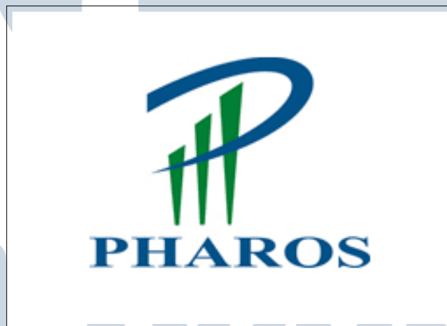
Gambar 2.1. Logo Perusahaan PT. Pharos Indonesia