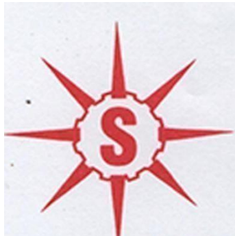
Gambar 2.1 Logo Perusahaan

Gambar 2.1 adalah logo perusahaan PT Sentral Electric, perusahaan yang bergerak di bidang distribusi elektronik. Sentral Electric adalah perusahaan perseorangan yang bergerak di bidang penjualan alat-alat listrik dan elektronik, secara grosir maupun etail, yang wilayah pemasarannya mencakup daerah daerah Jawa, Sumatera, Kalimantan, Sulawesi, Bangka Belitung dan sebagian wilayah timur.