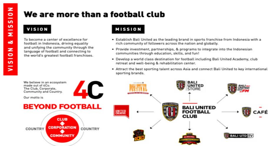
Gambar 2.6 Visi dan Misi Perusahaan

Bali United memiliki visi untuk menjadi pusat keunggulan dalam dunia sepak bola Indonesia yang mendorong kesetaraan dan menyatukan masyarakat melalui bahasa dan budaya sepakbola. Bali United Football juga menyediakan investasi, kemitraan dan program untuk komunitas melalui olahraga, pendidikan, keterampilan dan kesenangan. Bali United Academy dan banyak kemitraan yang terjalin bersama perusahaan kecil hingga besar, serta pengembangan pemain dan juga tim sepak bola ke kelas dunia merupakan contoh misi yang diterapkan oleh Bali United Football.