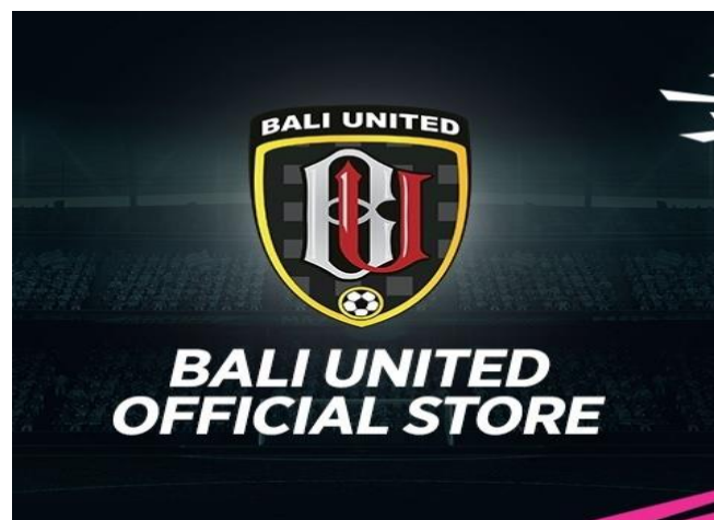
Gambar 2.4 Logo Bali United Store

Logo Bali United Football berkaitan erat dengan julukan untuk para penggemarnya, yaitu Serdadu Tridatu. Serdadu merupakan prajurit perang atau juga pejuang di medan perang, sedangkan Tridatu merupakan susunan benang yang memiliki filosofis oleh umat Hindu. Tridatu juga menggabungkan warna merah, putih dan hitam yang sampai sekarang melekat pada logo Bali United Football dan emas/kuning untuk melambangkan kemenangan.