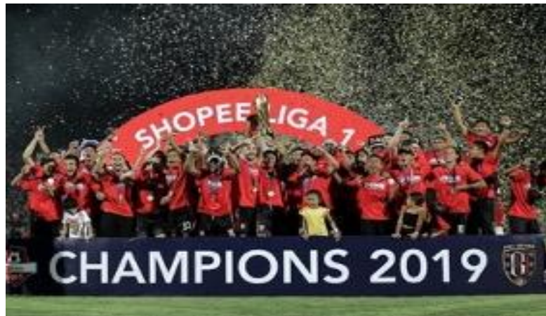
Gambar 2.1 BUFC Merayakan Kemenangan

Serdadu Tridatu adalah julukan untuk Bali United. Julukan ini menggunakan Bahasa asli Bali yang bermakna persatuan di Pulau Dewata. Lalu, Semeton Dewata adalah panggilan yang dibuat untuk para penggemar klub Bali United Football yang artinya saudara dan Dewata yang merupakan nama di mana Klub Bali United Football bernaung.