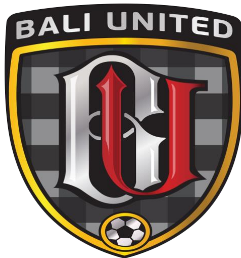
Gambar 2.3 Logo Bali United FC

Logo Bali United Football berkaitan erat dengan julukan untuk para penggemarnya, yaitu Serdadu Tridatu. Serdadu merupakan prajurit perang atau juga pejuang di medan perang, sedangkan Tridatu merupakan susunan benang yang memiliki filosofis oleh umat Hindu. Tridatu juga menggabungkan warna merah, putih dan hitam yang sampai sekarang melekat pada logo Bali United Football dan emas/kuning untuk melambangkan kemenangan.