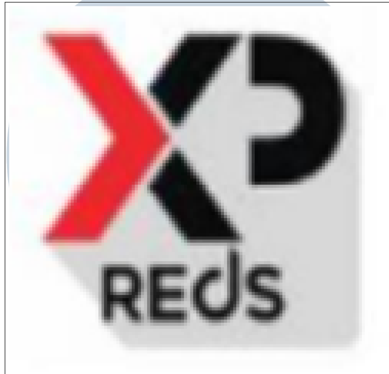
Gambar 1.4. Logo REDSXP

memasang aplikasi ke setiap client, melainkan tinggal menggunakan browser pada umumnya seperti Mozilla Firefox, Chrome, IE, dan lain-lain. Adapun Logo dari REDS XP dapat dilihat pada Gambar 2.4.