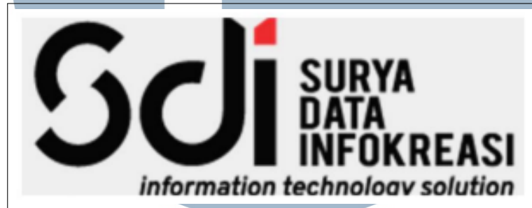
Gambar 1.1. Logo PT. Surya Data Infokreasi(SDI)

PT. Surya Data Infokreasi (SDI) merupakan perusahaan teknologi informasi yang berbasis konsultasi yang berdiri sejak tahun 2011 dengan spesialisasi dalam industri pakaian jadi/garmen dengan latar belakang kompetensi dan pengalaman dengan pasar Indonesia yang sangat dinamis. Adapun Logo dari PT. Surya Data Infokreasi (SDI) dapat dilihat pada Gambar 2.1.