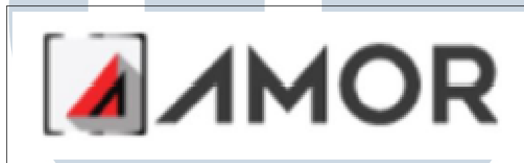
Gambar 1.2. Logo AMOR

PT. Surya Data Infokreasi (SDI) menawarkan empat produk dan dua servis, untuk produk yakni AMOR, XMOR, dan REDS XP, sedangkan untuk servis yakni PEOPLE COUNTING, dan WEB and MOBILE APP. AMOR merupakan sebuah solusi ERP yang telah melalui berbagai pengembangan dan berkelanjutan yang telah berpengalaman selama lebih dari satu dekade lebih sebagai praktisi di bidang garmen dan retail serta apparel. Adapun Logo dari AMOR dapat dilihat pada Gambar 2.2.