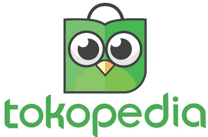
Gambar 2. 1. Logo Tokopedia