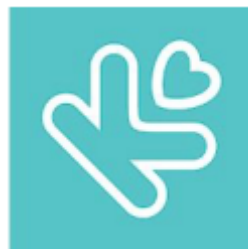
Gambar 2.4. Logo Kenalan