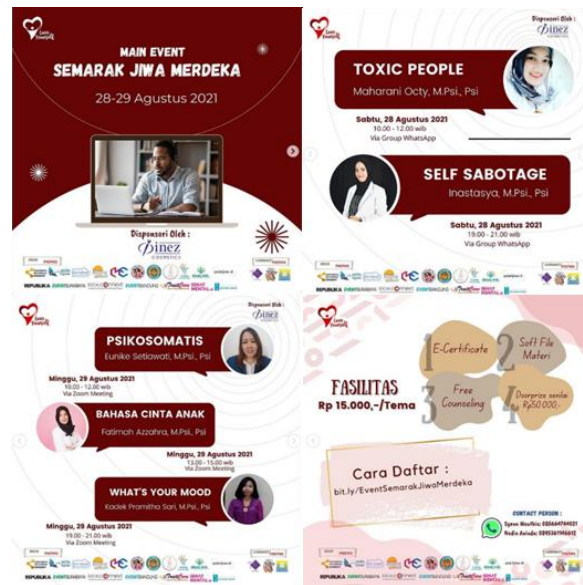
Gambar 2.2. Contoh Portofolio Yayasan Cintai Diri Indonesia