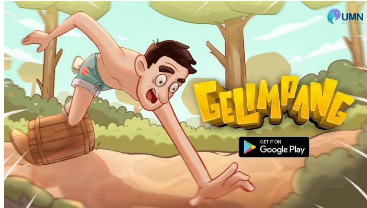
Gambar 2.2. Game Gelimpang

Selain UMN Pictures, PT Multimedia Digital Nusantara juga memiliki business unit UMN Research Center Department atau yang dikenal dengan UMN Consulting. Unit ini bergerak dalam menyediakan jasa pembuatan IP dalam bentuk riset yang terdiri dari berbagai bentuk report antara lain whitepaper , artikel, infografis, dan lainnya yang dapat digunakan sebagai strategi bisnis suatu perusahaan. UMN Consulting sendiri masih termasuk business unit baru dan memiliki target utama untuk mendapatkan traction/numbers pada jasa yang ditawarkan. Salah satu cara untuk mendapatkannya adalah melalui aplikasi Instagram.