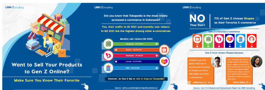
Gambar 2.4. Konten Instagram Carousel UMN Consulting