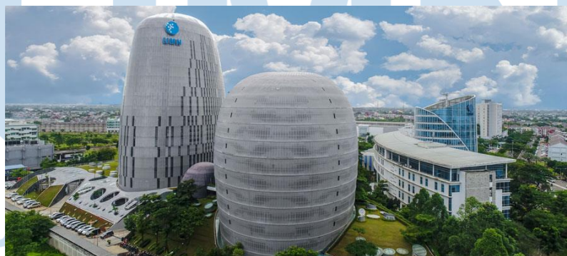
Gambar 2. 2 Kantor UMN Pictures