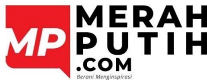
Gambar 2. 2 Logo MerahPutih.com

MerahPutih.com adalah sebuah media digital online yang menyajikan berita terpercaya. Dengan adanya media yang netral dan terpercaya diyakini dapat membawa inspirasi untuk setiap pembacanya untuk dapat terus berkarya. MerahPutih.com juga mempunyai sebuah tagline yaitu : "Berani Menginspirasi". Terdapat beberapa fitur yang tersedia di halaman web MerahPutih.com yaitu Berita, Indonesiaku, Hiburan & Gaya Hidup, Olahraga, Infografis, Foto dan Video.