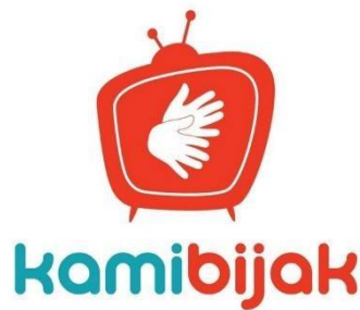
Gambar 2. 6 Logo Kamibijak.com

Kamibijak adalah singkatan dari Kami Berbahasa Isyarat Jakarta. Kamibijak.com merupakan sebuah media yang memberikan kemudahan untuk disabilitas untuk memperoleh informasi. Beberapa informasi yang diberikan dibuat dengan menggunakan bahasa isyarat dan teks sehingga mempermudah kaum disabilitas. Fitur-fitur yang terdapat pada website Kamibijak.com yaitu KabarBijak, BijakFun, Jalan-Jalan Kuliner, BijakFlash, Ruang KamiBijak, dan Bincang Isyarat.