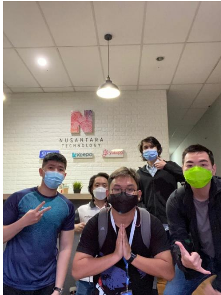
Gambar 2. 5 Foto penulis dengan Tim QA

" CEPAT " = Client Centric, Partner Centric, and Team Centric