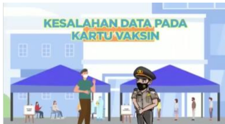
Gambar 2.4 Thumbnail Video Animasi Polri “Kesalahan Data Pada Kartu Vaksin”

Divisi Humas Polri salah satu unsur pengawas dan membantu pimpinan di bidang Hubungan Masyarakat pada tingkat Mabes Polri. Virus Media berperan untuk memproduksi video animasi. Biasanya video animasi di produksi untuk memberi informasi atau memperingati hari-hari penting.