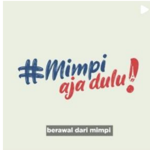
Gambar 2.3 Thumbnail Video Campus France

( https://www.instagram.com/p/CS_drzUFUtT/ )