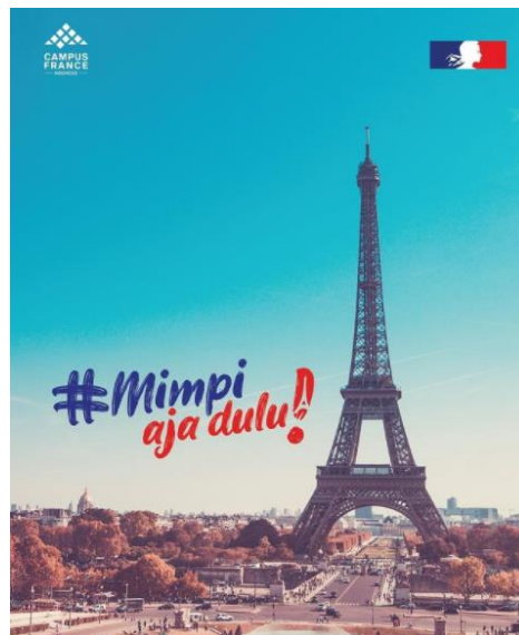
Gambar 2.2 Poster Campus France

Virus Media menghasilkan beberapa output bagi beberapa klien, salah satunya membuat branding Campus France dengan membuat konten promosi di sosial media mereka dengan bertemanan #mimpiajadulu.