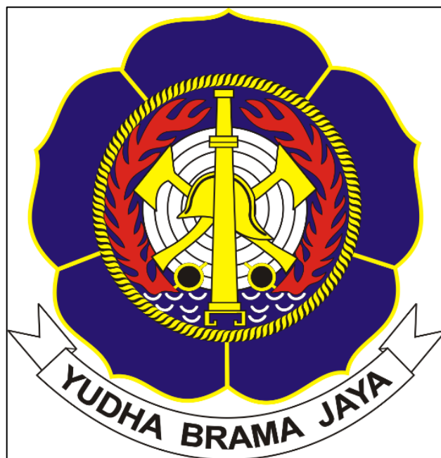
Gambar 2.1 Logo Dinas Penanggulangan Kebakaran dan Penyelamatan

Barat, Selatan, dan Timur. Kemudian terjadi revisi nomenklatur dengan judul sama, hanya terdapat perubahan pada nomenklatur Markas Wilayah menjadi Nomenklatur Suku Dinas. Pada masa 2002 sampai sekarang, penerbitan Surat Keputusan Gubernur Provinsi DKI Jakarta No.9 tahun 2002, tanggal 15 Januari 2002 tentang Organisasi dan Tata Kerja Dinas Pemadam Kebakaran Propinsi DKI Jakarta.