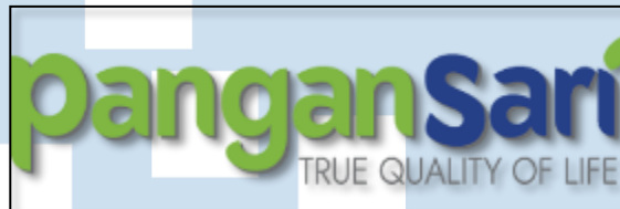
Gambar 2. 1 Logo PT. Pangansari Utama

Pertama kali PT. Pangansari Utama didirikan tahun 1976 di Kalimantan Timur tepatnya berada di Bontang, bertujuan untuk memenuhi keperluan pada PT. Pertamina Bontang khususnya dalam pelayanan catering dan food distribution. PT. Pangansari Utama ini juga melayani keperluan catering pada proyek – proyek oil company lainnya yang berada di wilayah Kalimantan Timur. Menanggapi permintaan klien, ruang lingkup kegiatan PSU diperluas ke industri catering dan layanan remote area untuk proyek-proyek di seluruh Indonesia. Secara paralel, PSU melengkapi sarana dan prasarana untuk menunjang kegiatan bisnisnya dengan mempunyai gudang pendingin (cool room) dan gudang dry sebagai bagian dari fasilitas pergudangan di Jakarta, Surabaya dan Balikpapan.