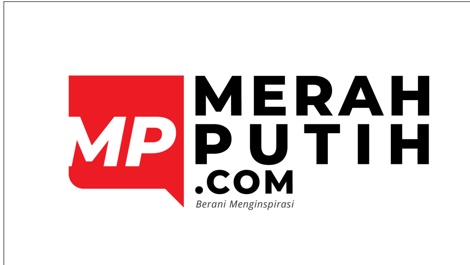
Gambar 2.1. Logo Merah Putih Media

Pada Gambar 2.1 merupakan logo Merah Putih Media. Logo tersebut mengandung tagline Berani Menginspirasi. Karena Merah Putih Media memiliki harapan yang besar agar pemuda-pemudi Indonesia berani untuk menginspirasi, bermula dari ide hingga menjadi sebuah aksi yang dapat mengubah bangsa ini secara perlahan ke arah yang lebih baik.