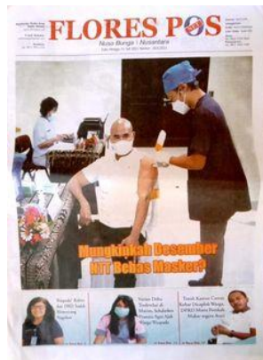
Gambar 2. 1 Tampilan Halaman Koran Flores Pos Net