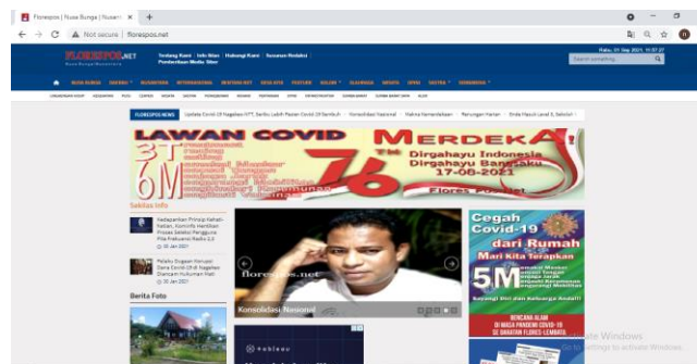
Gambar 2. 2 Website Flores Pos Net

Media cetak Flores Pos Net terbit setiap minggu untuk menyebarkan berita dan informasi yang menarik dan ditulis secara mendalam oleh para wartawan Flores Pos Net . Sedangkan, media online Flores Pos Net juga menyajikan berita di web resminya dengan berbagai berita dari berbagai kota atau kabupaten yang berada di daratan Flores. Media Flores Pos Net tidak hanya memberikan berita di daratan Flores saja, akan tetapi berita dari luar Flores pun juga hadir dalam media ini, diantaranya ada berita dari wilayah Kupang, Timor dan Jakarta.