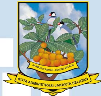
Gambar 2.1 Logo Jakarta Selatan

Lambang Kotamadya Jakarta Selatan berbentuk perisai lima didalamnya terlukis pohon Rambutan dan buah Rambutan Rapih (Flora)