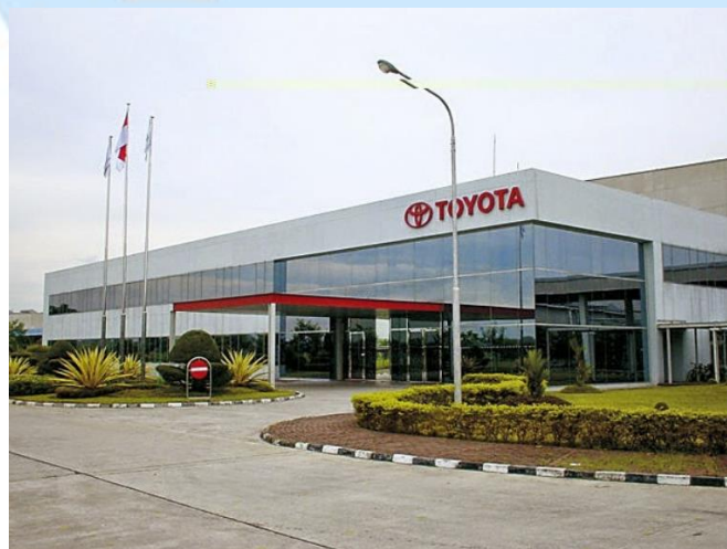
Gambar 2.2 Foto PT Toyota Motor Manufacturing Indonesia di Karawang

Selain itu TMMIN juga telah melakukan ekspor selama lebih dari 43 tahun ke lebih dari 72 negara.