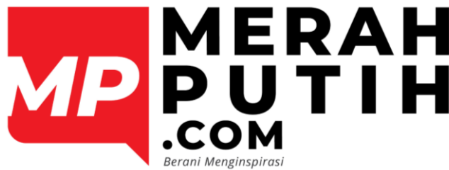
Gambar 2. 1 Logo Merahputih.com