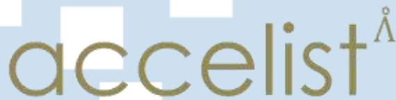
Gambar 2. 1 Logo PT Accelist Lentera Indonesia [8]

PT Accelist Lentera Indonesia merupakan perusahaan yang didirikan pada tanggal 3 Agustus 2012, dimana perusahaan ini berpusat Brooklyn Office Tower, Alam Sutera Boulevard, Serpong Utara, Tangerang Selatan, Banten dan memiliki Training Center yang berlokasi di Ruko Bolsena, Gading Serpong. Perusahaan ini bergerak di dua bidang, yaitu bidang teknologi dan bidang aviasi. Pada bidang teknologi, PT Accelist Lentera Indonesia menyediakan jasa berupa IT consulting , web application development , mobile development , hingga menyediakan produk berupa Single Sign On dan Mobile Device Management . Sedangkan pada bidang aviasi, PT Accelist Lentera Indonesia menyediakan peralatan yang berkaitan dengan aviasi mulai dari ground support equipment , engineering tools sampai dengan consumable parts .