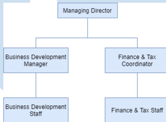
Gambar 2. 3 Struktur Organisasi PT Accelist Lentera Indonesia (Aviation) [8]

Pada gambar 2.3 merupakan struktur organisasi yang ada di PT Accelist lentera Indonesia bagian aviasi, dimana jabatan tertinggi adalah Managing Director atau Founder. PT Accelist Lentera Indonesia bagian aviasi memiliki beberapa divisi dan role di dalam struktur organisasinya, berikut penjelasan dari masing-masing divisi dan rolenya, antara lain :