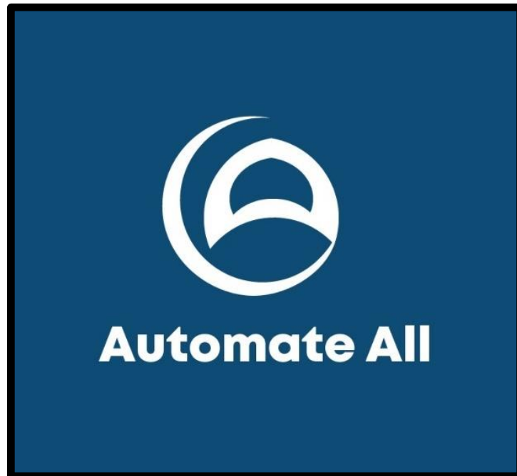
Gambar 2.1 Logo CV Solusi Automasi Indonesia

CV Solusi Automasi Indonesia atau yang lebih dikenal dengan Automate All merupakan salah satu start-up yang bergerak pada bidang teknologi yang berdiri pada tahun 2020 dan berlokasi di Bandung Techno Park, Jl. Telekomunikasi, Buah Batu 40257. Untuk website Automate All sendiri dapat diakses melalui https://automateall.id/ . Automate All sendiri merupakan start-up yang bergerak pada bidang teknologi dengan menyediakan layanan berupa jasa automasi pada proses bisnis baik pada perusahaan maupun pada usaha perseorangan atau kelompok. Automate All sendiri berfokus dalam bidang Robotic Process