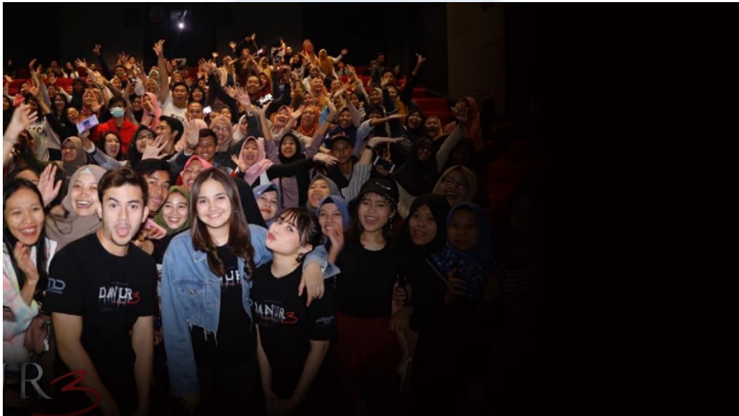
Gambar 2.2 Meet & Greet with Movie Casts