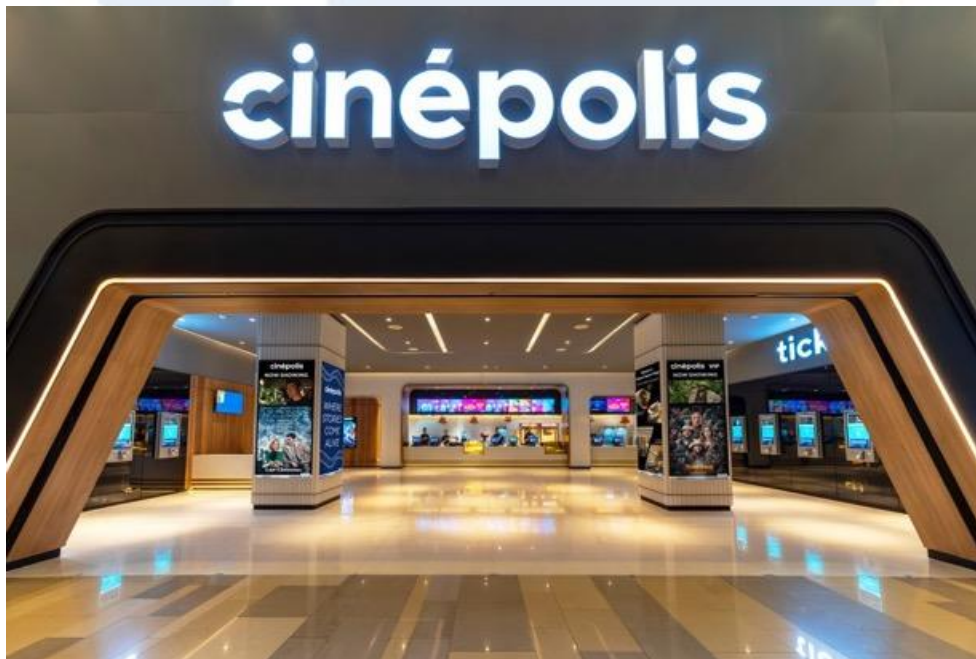
Gambar 2.1 Cinépolis Cinemas di Pejaten Village