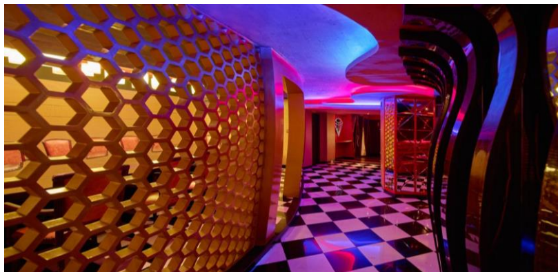
Gambar 2.4 Coffee Shop Istana Nelayan Hotel