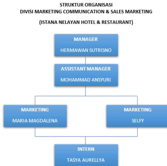
Bagan 2.2 Struktur Organisasi Divisi Marketing Communication & Sales

Dalam proses praktik kerja magang yang berlangsung selama 3 bulan ini, penulis bergabung dalam divisi Marketing Communication & Sales Marketing , namun lebih condong ke bagian marketing communication nya, hal ini dikarenakan divisi marcom dan sales marketing di Istana Nelayan tergabung menjadi satu.