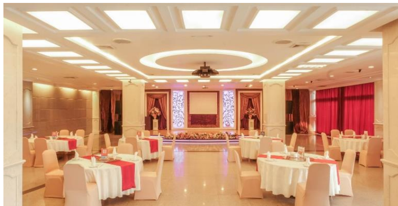
Gambar 2.2 Ballroom Hotel Istana Nelayan