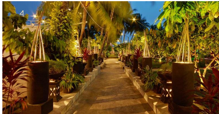
Gambar 2.7 Cocoa Grounds Istana Nelayan Restaurant & Café