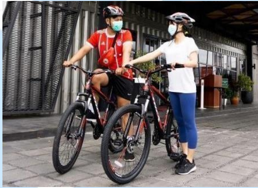
Gambar 2. 7 Rental Bike

Qubika Hotel menyediakan rental sepeda gratis bagi para tamu yang berkunjung. Fasilitas tersebut sangat cocok bagi para tamu yang ingin berolahraga pagi sambil berkeliling menikmati suasana Tangerang.