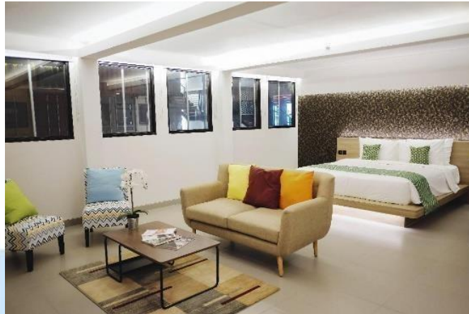
Gambar 2. 5 Club Suite Room