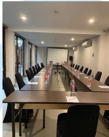
Gambar 2. 8 Meeting Room 1 & 2

Ruangan pada meeting room I ini memiliki luas sebesar 12 x 3,8 meter yang biasanya digunakan untuk acara rapat dengan dilengkapi proyektor dan sound system .