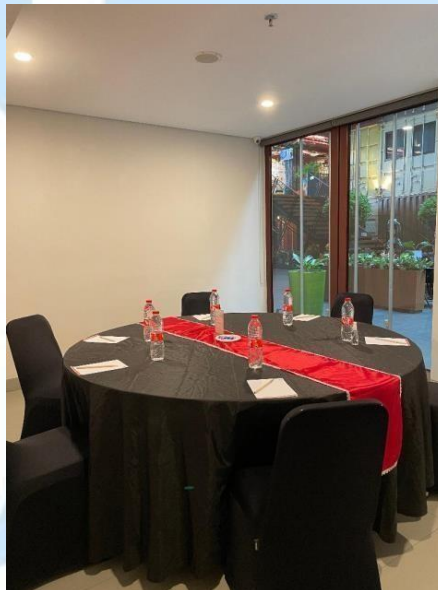
Gambar 2. 10 Meeting Room 6

Ruangan ini memiliki luas sebesar 4,7 x 3,5 meter yang biasanya digunakan untuk acara rapat dengan dilengkapi proyektor dan sound system .