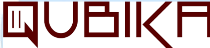
Gambar 2. 1 Logo Hotel Qubika Gading Serpong

Hotel ini cocok untuk menggelar event maupun tempat meeting untuk para pebisnis. Selain itu, hotel Qubika cocok untuk para traveller dan tamu yang ingin merasakan liburan di tengah kesibukan kota maupun pekerjaan mereka.