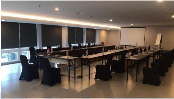
Gambar 2. 11 Meeting Room 8