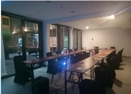
(Sumber Qubika Boutique Hotel Gading Serpong) Gambar 2. 9 Meeting Room 3, 4, 5, & 7