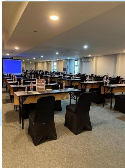
Gambar 2. 12 Meeting Room 9 & 10

Ruangan ini memiliki luas sebesar 20 x 7 meter yang biasanya digunakan untuk acara rapat maupun wedding dengan dilengkapi proyektor dan sound system .