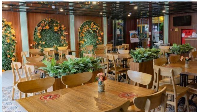
Gambar 2. 6 Portable Kitchen and Lounge Qubika

Restaurant Qubika menyajikan makanan dengan menu buffet maupun a'la carte untuk makan siang maupun makan malam bagi para pengunjung. Portable Qubika yang letaknya berada di bawah lobby Qubika Hotel sering sekali menerapkan live cooking show dengan berbagai varian menu. Selain itu Portable Qubika juga menyediakan tempat outdoor dan indoor bagi para tamu yang ingin menyantap hidangan makanan di Portable Qubika.