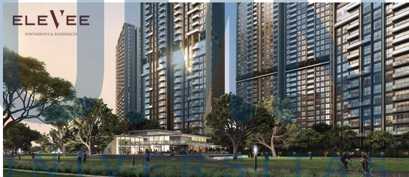
Gambar 2.1 Elevee Penthouses & Residences

PT Alam Sutera Tbk merupakan perusahaan yang bergerak pada property developer atau pengembang. Pertama kali PT Alam Sutera Tbk didirikan pada 3 November 1993 dengan nama PT Adhiutama Manunggal. Dalam proses pengembangan propertinya, PT Alam Sutera Tbk berusaha menciptakan produk yang menjawab kebutuhan dari masyarakat serta memiliki Value yang tinggi. Dalam praktiknya PT Alam Sutera Tbk memiliki anak perusahaan yaitu PT Alfa Goldland Realty. Sebagian besar produk properti yang dipegang oleh PT Alfa Goldland Realty. Pada awal tahun 2020 ini, PT Alfa Goldland Realty menciptakan sebuah produk baru yaitu hunian berbentuk apartemen. Hunian tersebut merupakan salah satu produk terbaru yang diberi nama EleVee Penthouses & Residences.