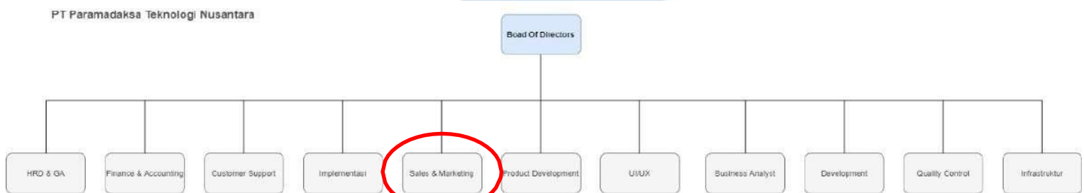
Gambar 2.1 Bagan Struktur Organisasi PT Paramadaksa Teknologi Nusantara