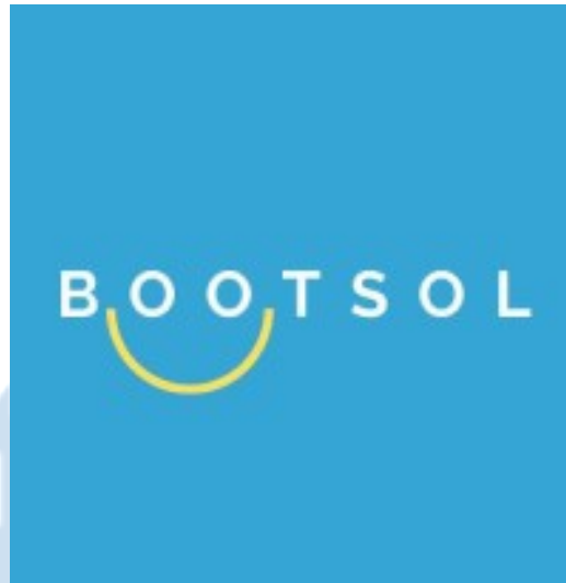
Gambar 1 Logo Bootsol