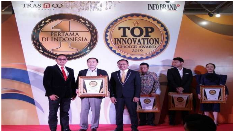
Gambar 2.2 COO GreatDay HR Menerima Penghargaan Tahun 2019