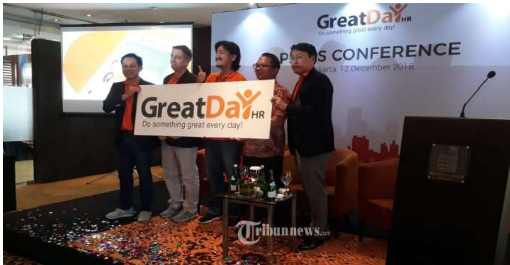
Gambar 2.1 SunFish Go Melakukan Rebranding Menjadi GreatDay HR