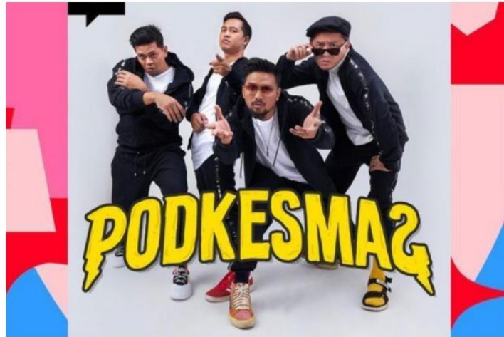
Podcast Podkesmas kerap membahas cerita dewasa.