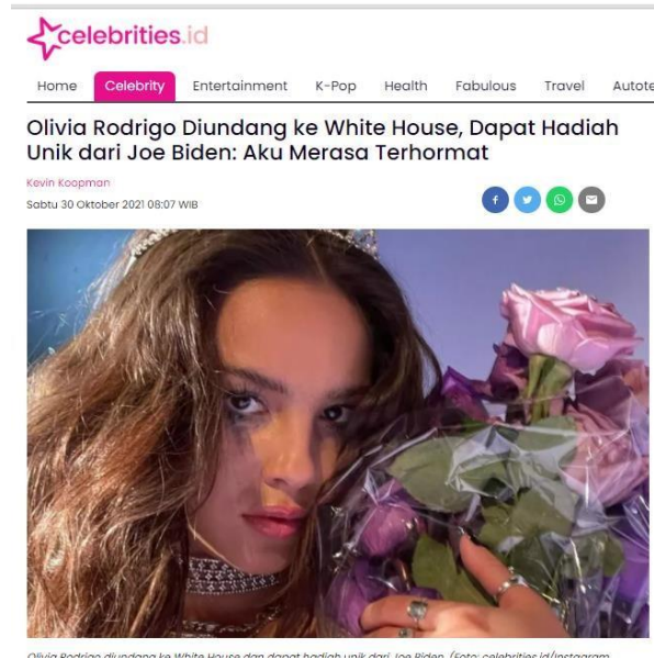
Gambar 3.1 Salah Satu Contoh Berita Harian

visual atau audio visual sehingga penulis harus menerjemahkan dan menyusun ulang konten artikel dari media internasional ke versi bahasa Indonesia. Setelah artikel selesai dikerjakan, penulis mengirimkan ke grup yang sama untuk disunting dan juga dievaluasi oleh redpel dan editor. Setelah itu, berita diunggah ke laman resmi oleh editor.