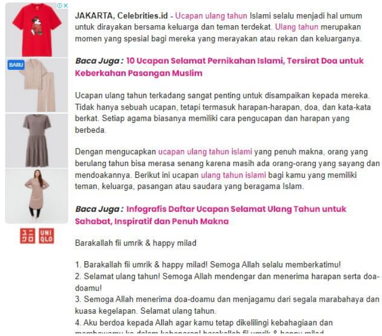
Gambar 3.4 Bagian Isi Artikel SEO