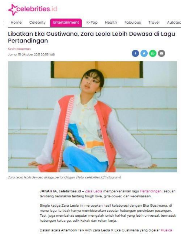
Gambar 3.5 Salah Satu Atikel Konferensi Pers

reporter magang. Pertanyaan wawancara pada live dikirimkan ke grup untuk dipilih angle yang akan diangkat. Untuk penugasan wawancara artis di Gedung iNews, menunggu arahan dari pemred dan reporter reguler Celebrities.id . Daftar pertanyaan wawancara artis dibuat oleh reporter reguler yang kemudian dikembangkan oleh penulis. Pada saat melakukan wawancara, penulis didampingi oleh reporter reguler. Seringkali, dalam satu kali wawancara kami mewawancarai dua narasumber sehingga penulisan reporter reguler membagi tugas siapa yang akan mewawancarai artis siapa.