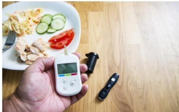
Makan pakai tangan dapat mencegah terkena diabetes level 2.

JAKARTA, celebrities.id - Pasien diabetes sangat memerlukan dukungan dari keluarga dan orang terdekat. Bukan hanya mengikuti arahan dan pengobatan dari dokter.