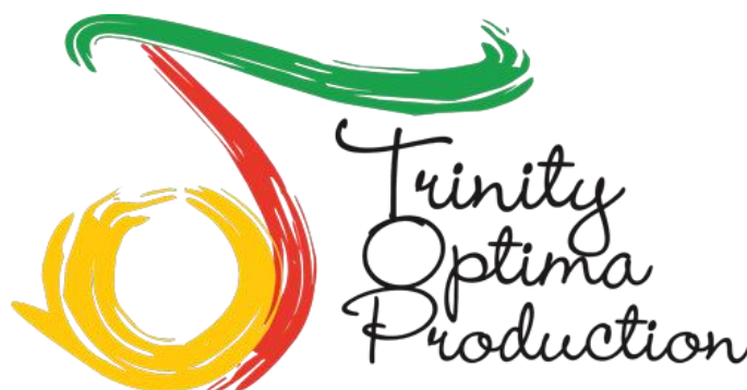
Gambar 2.1 Logo Trinity Optima Production