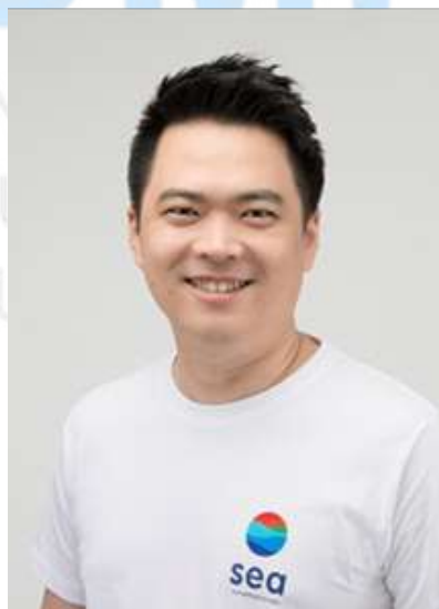
Gambar 2. 5 CEO Shopee