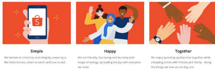
Gambar 2.1 Nilai Shopee

Sebagai bagian dari perusahaan Sea Group, Shopee juga menanamkan nilai-nilai yang diterapkan oleh perusahaan besar yang memayunginya, yang terdiri dari: