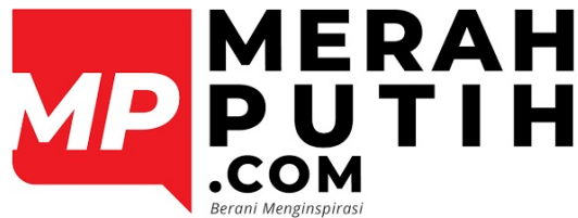
Gambar 2.2. Logo Merahputih.com