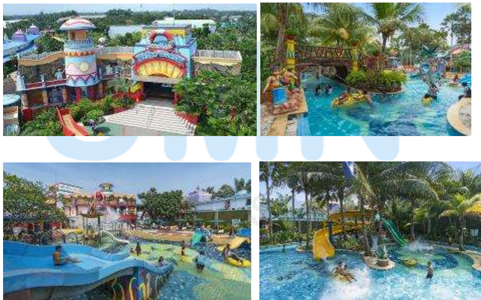
Gambar 2.1 Wahana CitraRaya Water World

Salah satu fasilitas terbesar di CitraRaya Tangerang adalah CitraRaya Water World. CitraRaya Water World yang merupakan salah satu properti CitraRaya Tangerang, yaitu salah satu proyek dari PT. Ciputra Residence. Awalnya, CitraRaya Water World hanya bertujuan untuk menjadi fasilitas penunjang penghuni CitraRaya Tangerang. Namun saat ini, Citra Raya Water World merupakan salah satu taman rekreasi air terbesar dan terlengkap di Banten. CitraRaya Water World berlokasi di Jl. Citra Raya Utama Timur, Mekar Bakti, Kec. Cikupa, Tangerang, Banten. Citra Raya Water World memiliki luas lima hektar yang menawarkan beragam wahana air. Wahana air yang ada di CitraRay Water World di antaranya adalah baby pool , wave pool , olympic pool , wide slider , power slider , dan berbagai wahana air lainnya. Selain itu, CitraRaya Water World juga menyediakan fasilitas pengunjung seperti café dan resto, ruang p3k, penyewaan ban, musholla, loker, dan lain sebagainya.