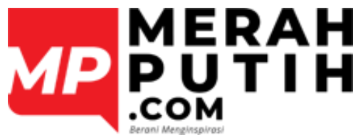
Gambar 2.1 Logo Merah Putih

Merahputih.com merupakan sebuah portal berita yang menyajikan beragam informasi dimulai dari nasional hingga internasional. Halaman webnya memiliki berbagai kanal, yaitu Berita, Indonesiaku, Hiburan & Gaya Hidup, Olahraga, Infografis, Foto, dan Video. Dilihat pada kanalnya yang beragam tersebut cukup mewakili berbagai informasi terkini secara keseluruhan. Merahputih.com memiliki komitmen dalam memberikan pemberitaan secara akurat dan dapat dipercaya..