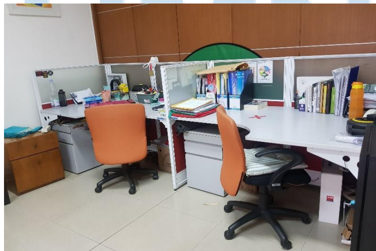
Gambar 2. Office Room