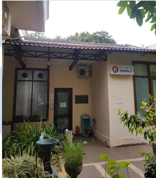
Gambar 5. Klinik Pratama Ampera 20