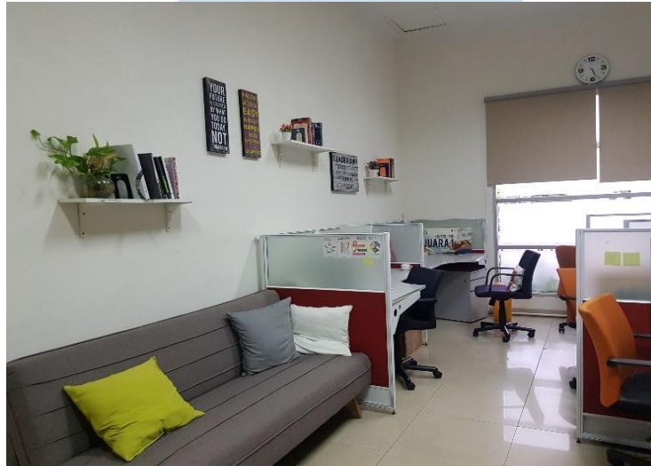
Gambar 3. Creative Spot