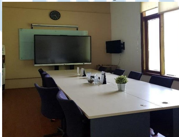
Gambar 4. Meeting Room