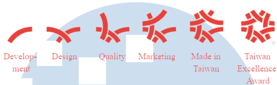
Gambar 2.2 Filosofi Logo Taiwan Excellence