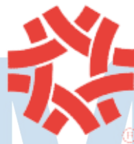
Gambar 2.1 Logo Taiwan Excellence

Taiwan Excellence adalah salah satu anak perusahaan Taiwan External Trade Development Council (TAITRA) yang bergerak dalam bidang pemasaran produk-produk pemenang penghargaan Taiwan Excellence. Penghargaan Taiwan Excellence sendiri adalah sebuah penghargaan yang dibuat oleh Kementerian Ekonomi Taiwan pada tahun 1993 untuk mendorong pengusaha pabrik Taiwan agar meningkatkan kualitas, desain, dan citra produk dengan tujuan untuk menjadikannya sebagai teladan bagi industri serta memperkuat daya saing Taiwan di pasar internasional. Meski baru beroperasi pada tahun 1993, pada tahun 1992 Kementerian Ekonomi Taiwan telah terlebih dahulu membentuk logo Taiwan Excellence (Taiwan Excellence, 2021).