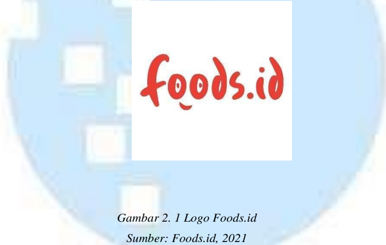
Gambar 2. 1 Logo Foods.id