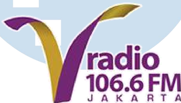
Gambar 2.1 Logo V Radio

Dengan adanya tagline baru V Radio yaitu Lagu Hitsnya Beda , V Radio menyajikan music dari tahun 90an hingga 00an sehari penuh untuk memanjakan para V Listeners dan pendengar bebas merequest lagu di setiap programnya.