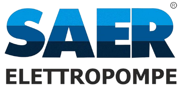
Gambar 2. Logo SAER Elettropompe

SAER Elettropompe merupakan produsen pompa air asal Italia yang terletak di Guastalla, Reggio Emilia, Italia. SAER Elettropompe didirikan oleh Carlo Favella pada tahun 1951 dan memiliki pengalaman selama 70 tahun dalam bidang pompa air. SAER Elettropompe bekerja sama dengan PT Sarana Era Indonesia untuk melakukan distribusi atas pompa air merk SAER di Indonesia.