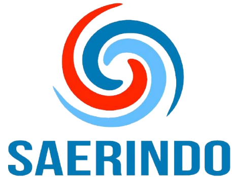
Gambar 1. Logo PT Sarana Era Indonesia

PT Sarana Era Indonesia merupakan perusahaan yang bergerak di bidang pompa air, dimana perusahaan berposisi sebagai distributor tunggal eksklusif merek pompa SAER Elettropompe di Indonesia. PT Sarana Era Indonesia didirikan oleh Bapak Yohanes Roman pada tahun 2018. PT Sarana Era Indonesia merupakan perwujudan dari visi Bapak Yohanes dalam memberikan masyarakat Indonesia kualitas dalam pemompaan melalui produk-produk SAER Elettropompe.