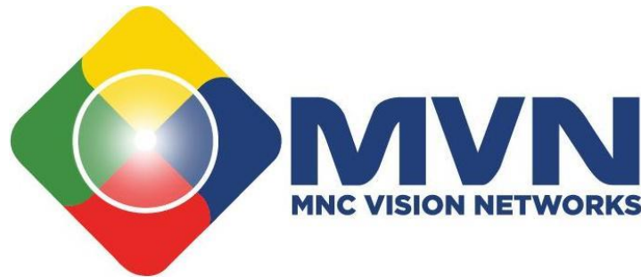
Gambar 2.2 Logo MNC Vision Networks