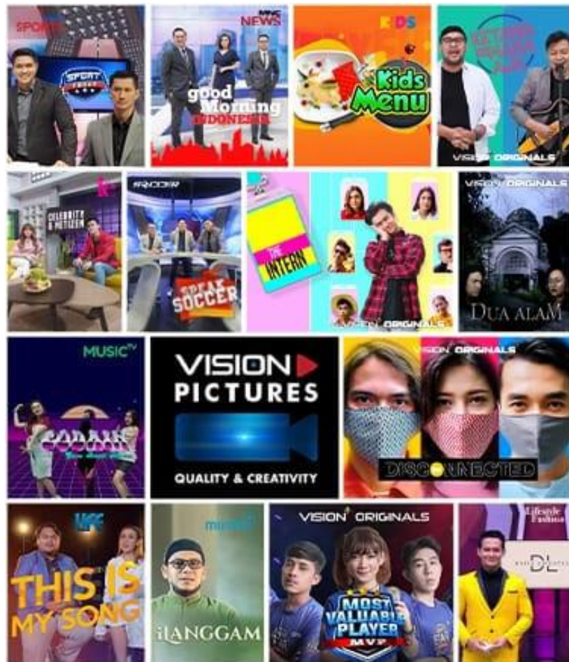
Gambar 2.1 Hasil Garapan Vision Pictures