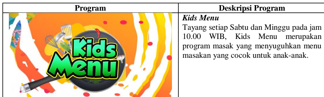
Tabel 2.1 Program Departemen KIDS TV

Berikut adalah program yang dikerjakan penulis selama kerja magang di departemen KIDS TV sebagai asisten produksi: