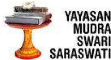
Gambar 2.1 Logo Yayasan Mudra Swari Saraswati

Yayasan Mudra Swari Saraswati juga menaungi acara yang diadakan setiap bulannya yang bertujuan untuk memperkenalkan produk lokal Ubud sampai seniman dan musisi Bali kepada panggung internasional pada event Ubud Artisan Market. Selain itu, Ubud Food Festival juga merupakan bagian dari Yayasan Mudra Swari Saraswati.