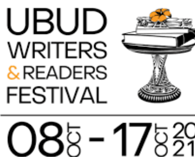
Gambar 2.2 Logo Ubud Writers and Readers Festival 2021