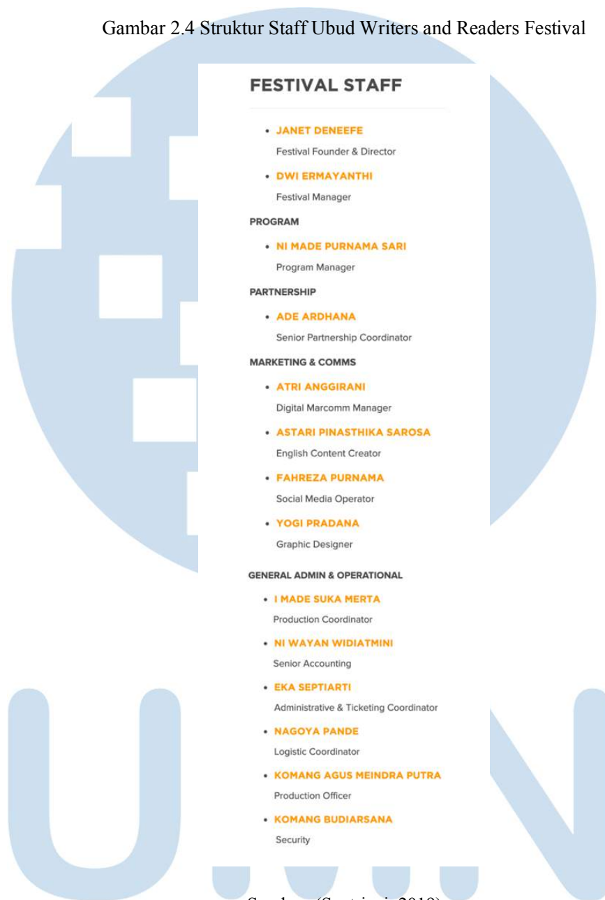
Gambar 2.4 Struktur Staff Ubud Writers and Readers Festival