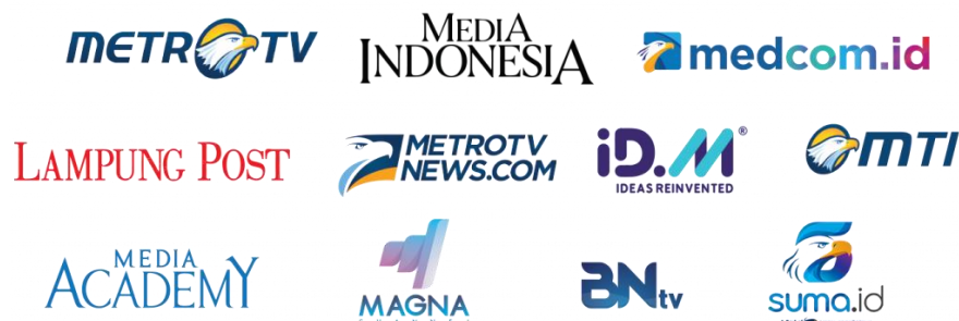
Gambar 2.1 Media di Bawah Naungan Media Group

PT Citra Multimedia Indonesia atau Medcom.id adalah salah satu media daring untuk mengakses situs berita dan artikel di Indonesia yang didirikan pada tahun 2017. Medcom.id hanya memiliki edisi daring dan merupakan bagian dari Media Group. Media Group merupakan sebuah perusahaan yang bergerak di bidang media massa, properti, media iklan, restoran, dan sumber daya alam.