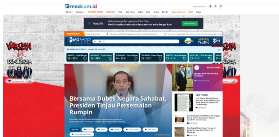
Gambar 2.3 Tampilan Situs Medcom.id