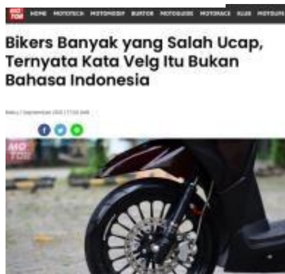
Gambar 3. 4 Artikel Penulis Yang Diterbitkan

Jika berita penulis dirilis dalam web, maka dibagian “penulis berita” tidak bisa ditulis nama penulis karena adanya sistem CMS yang hanya bisa membaca nama karyawan media saja, sehingga nama penulis hanya ditulis sebagai “Motorplus”.