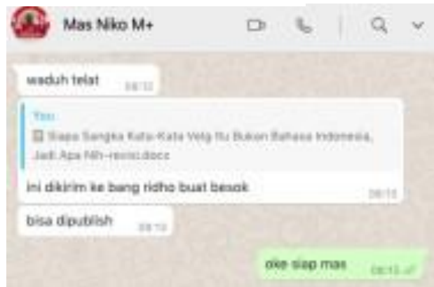
Gambar 3. 3 Revisi Tulisan