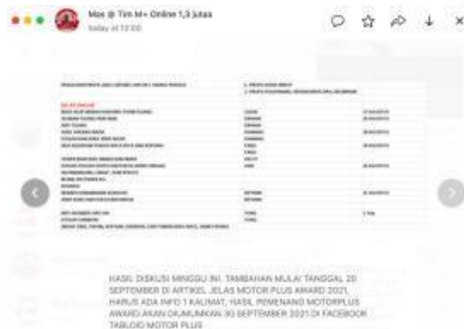
Gambar 3. 1 Penugasan Penulisan Artikel