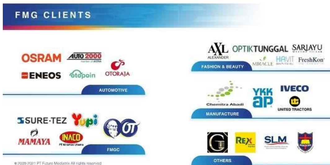
(Sumber Dokumen Future Mediatrix Group,2020) Gambar 2. 2 Klien Future Mediatrix Group