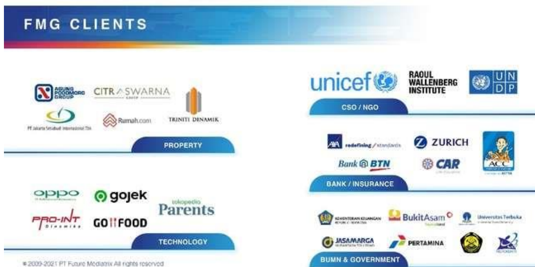
(Sumber Dokumen Future Mediatrix Group,2020) Gambar 2. 1 Klien Future Mediatrix Group