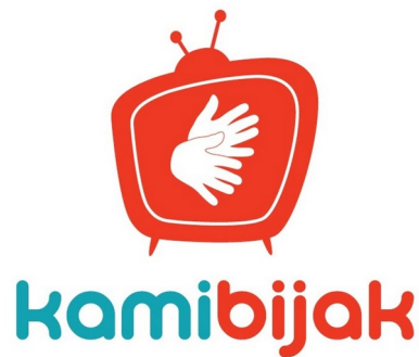
Gambar 2.2 Logo KamiBijak

diperkenalkan untuk pertama kalinya pada acara Hari Bahasa Isyarat Internasional 2018 di Gedung Kementerian Komunikasi dan Informatika pada tanggal dari tanggal 22 hingga 23 Oktober 2018.